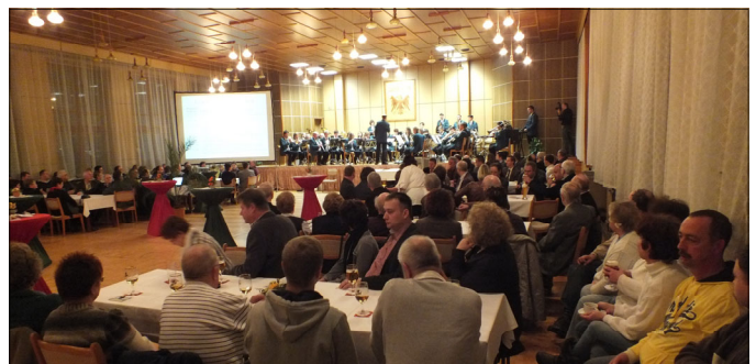
Der Große Saal des Landgasthauses „Zum Adler“ war mit 220 Gästen aus Dardesheim und den Nachbargemeinden auch diesmal gut gefüllt