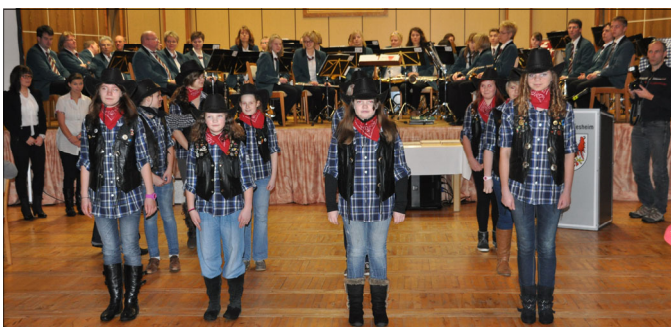
Das Dardesheimer Stadtorchester sorgte für beste Stimmung und die Linedancer der Sekundarschule beeindruckten mit ihrer gut einstudierten Tanzformation